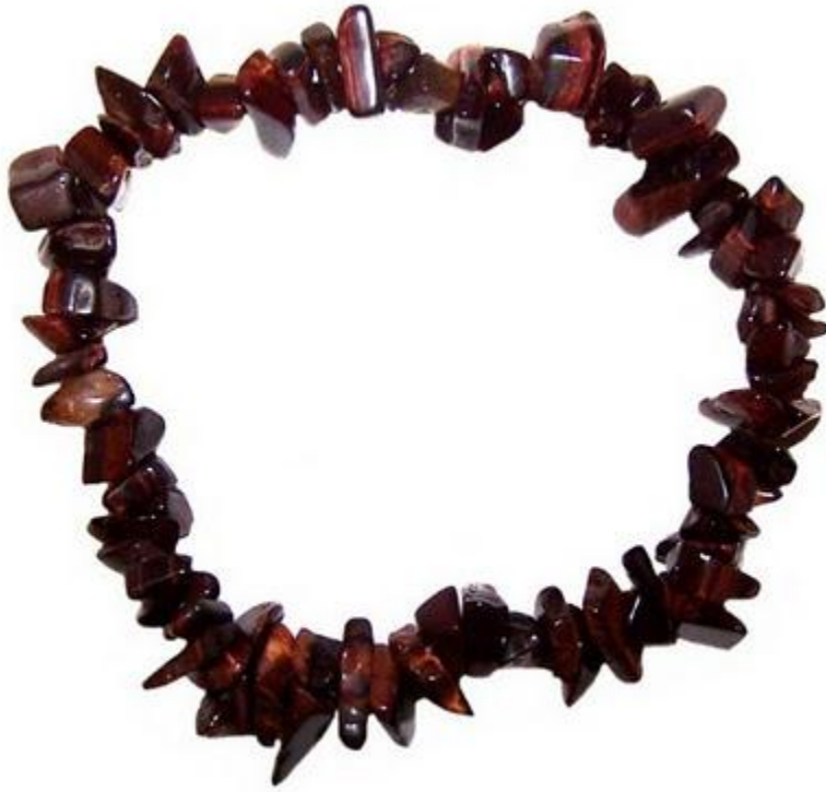
Ojo de Tigre Rojo

El Ojo de Tigre en general es un balanceador emocional que sutaliza la tenacidad y da claridad a la introspección. Va a enraizar y centrar, además de fortalecer la conexión con la voluntad y el poder personal.